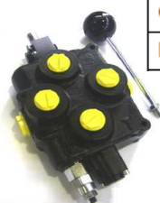
BM100 / BM180