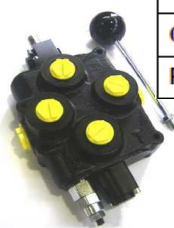
BM100 / BM180