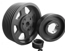
--- POLEAS y TAPER ---