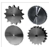
---DISCOS y PIÑONES ---